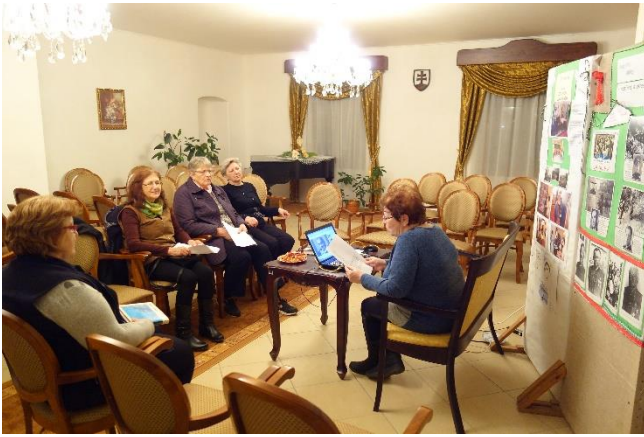
stretnutia priaznivcov literatúry - HALIKLUB