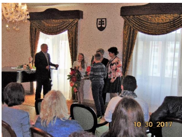
ocenenie knihovníkov a spolupracovníkov knižnice