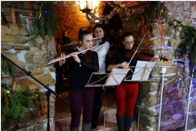
snahou MsKS je využívať aj pivničné priestory