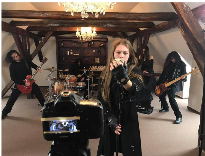
hudobná skupina GLOOM v kaštieli