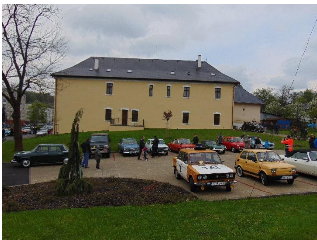
celomestské podujatie - autá veteráni