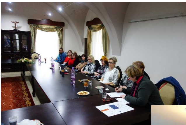
školenie sociálna práca