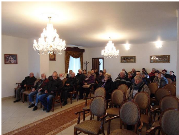
návšteva - exkurzia dôchodcov z Prešova

Kaštieľ pri hlavnej ceste zaujme svojou premenou zo starého na nový a mnoho návštevníkov zavíta na jeho obhliadku. Prichádzajú celé skupiny aj jednotlivci. Najviac sa to týka letného obdobia, vtedy riaditeľka MsKS poskytuje výklad o histórii kaštieľa, jeho rekonštrukcii, sprevádza turistov.