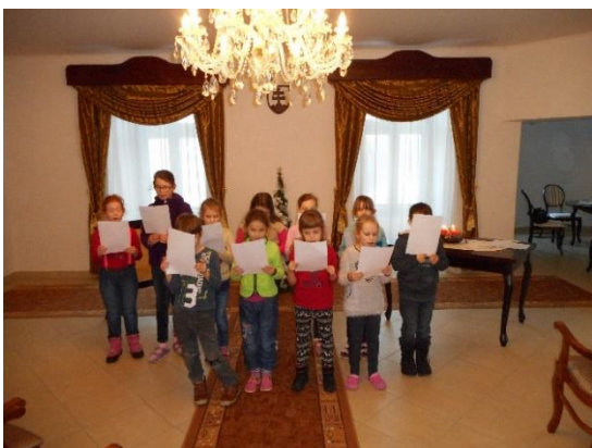
... a čítame, čítame ...