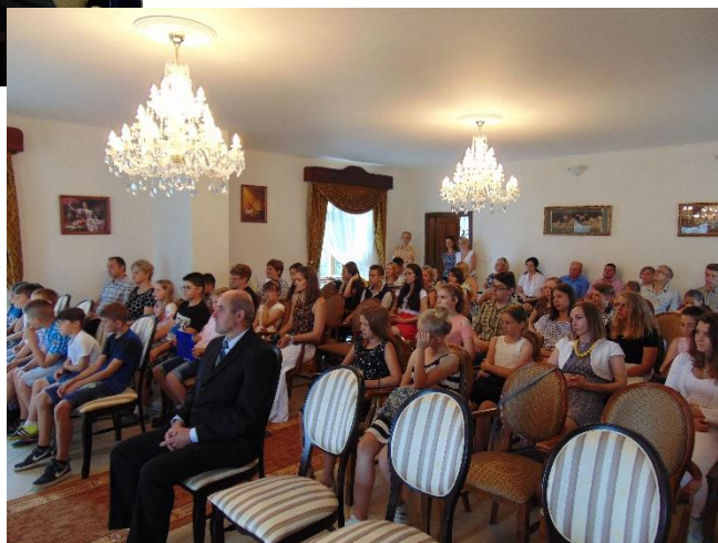
ocenenia žiakov a učiteľov