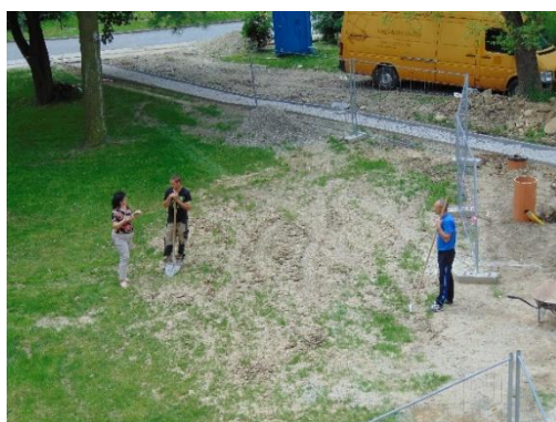
riešenie úloh pri stavebných prácach prechádzajúcich našim pozemkom, na rekonštrukcii vedľajšej budovy patriacej múzeu