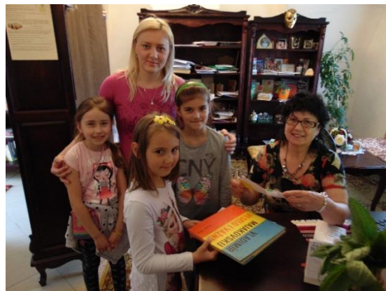
zápisy nových čitateľov